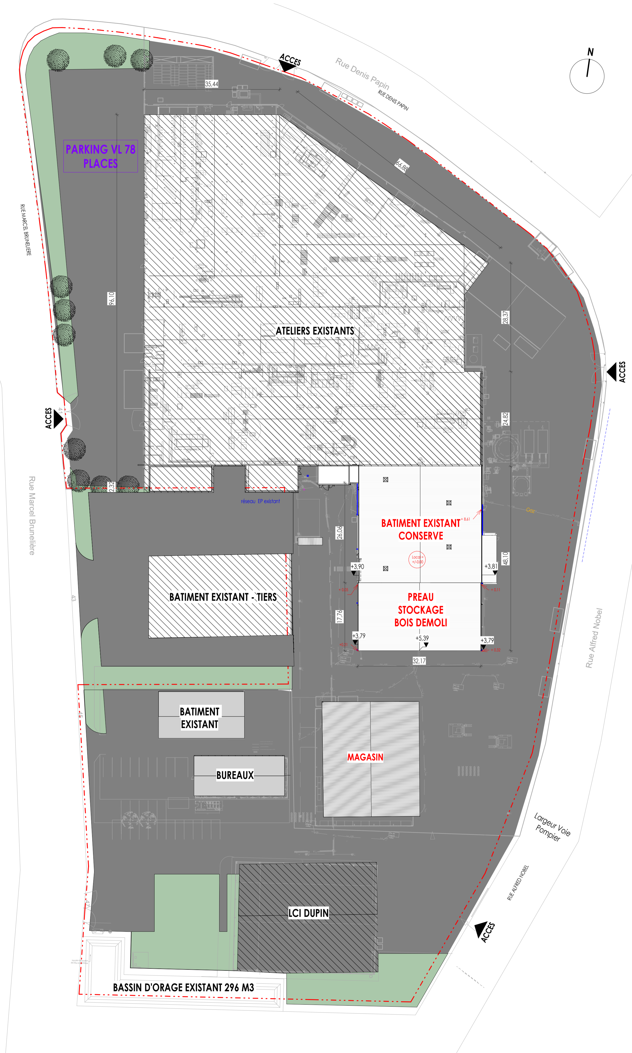
PLAN DE MASSE EXISTANT ECHELLE : 1 : 500

SECTION AX PARCELLES: N°33 et N°37 SURFACE TOTALE: 6184 m 2